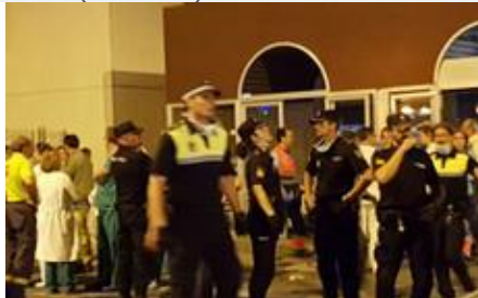
Personal sanitario, Policía local y Nacional y pacientes, frente a las puertas del Hospital.