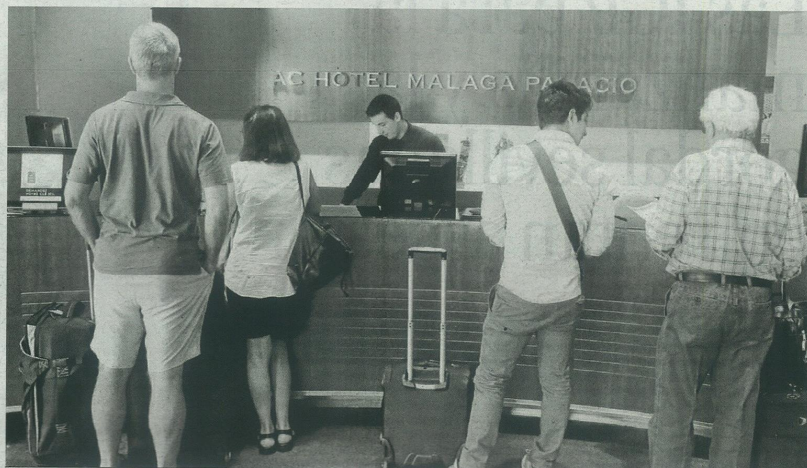
Turistas en la recepción de un hotel de Málaga.

Andalucía aglutinó el 21,3% del total de pernoctaciones de