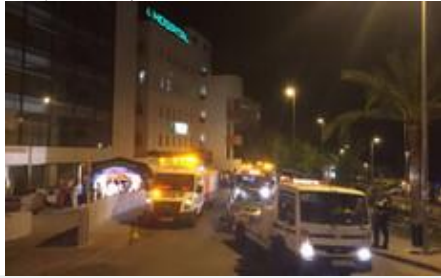
El servicio de emergencias del 112 desplegó un puesto de mando avanzado frente al hospital.

R.D., JEREZ | ACTUALIZADO 24.05.2016 - 11:16