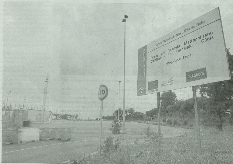
Cartel de las obras del tranvía colocado junto a La Ardila, donde está prevista la construcción de un apeadero que funcionará como estación de autobuses. ROMÁN REYES

● Adif no ha autorizado aún la utilización del tramo de la vía férrea hasta Cádiz aunque mientras se planean pruebas parciales entre La Isla y Chiclana, como las de 2014