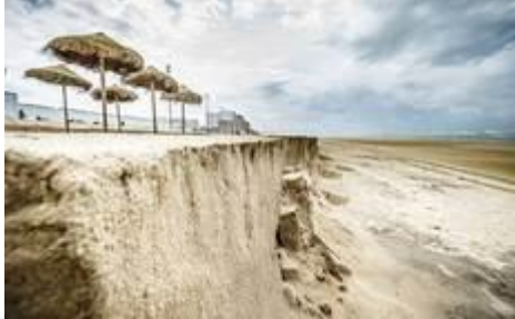
Escalón de arena que ha quedado en la playa Victoria, en las inmediaciones del chiringuito Sotavento, a causa del temporal.

La Dirección General de Sostenibilidad de la Costa y el Mar está evaluando los daños del temporal para "realizar acciones urgentes".